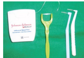
歯間を磨くデンタルフロス（糸ようじ）と歯間ブラシ