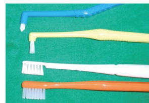
通常の歯ブラシと届きにくい歯間部分を磨く歯ブラシ（上2本）