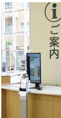
サーモグラフィ (非接触型体温測定器)