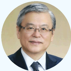
東京大学名誉教授 病理専門医

この度、東京大学から旭中央病院に移り、遠隔病理診断センター（アサヒテレパソセンター）を開設いたしました。