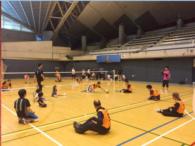
ローリングバレー