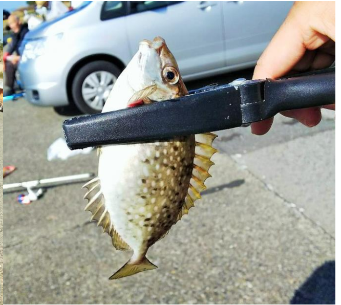
↑ 10月に釣り上げた「アイゴ」

みなさんこんにちは。和希楽会釣り部です。4月から活動してきた和希楽会釣り部の活動ですが、平成30年度は10月で活動を終了致しました。ご参加頂いた皆様、ありがとうございました。