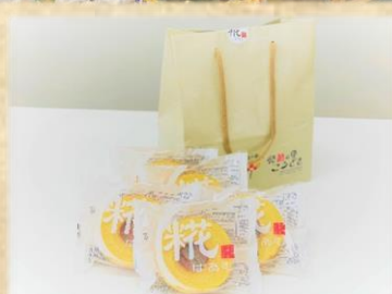
糍ばあむ 200 円