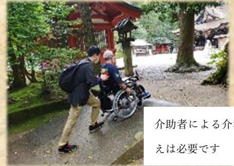
介助者による介添えは必要です