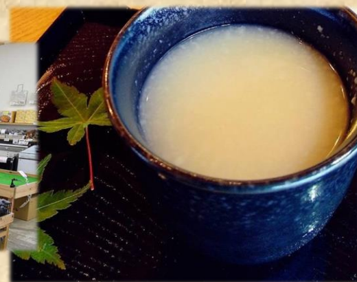
甘酒 250 円