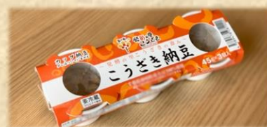
こうざき納豆 200 円