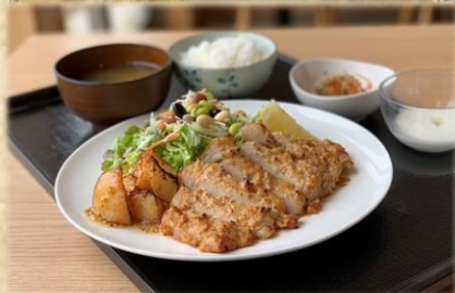
米糍味噌で漬け込んだトンテキ定食 1280 円