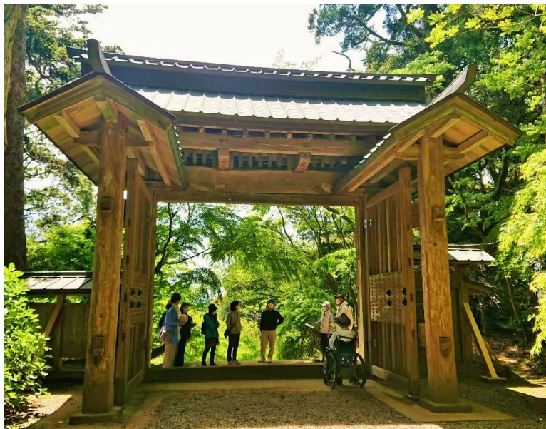
歴史ある「総門」の説明を熱心に聞く

運動しながら自然と歴史を堪能した後は、最後に講堂裏の牡丹園を見学！見学を通じて心の洗濯をしたような、とてもすがすがしい気分になりました。参加者もとても良いリフレッシュになった様子で、特に牡丹の花より美しい付き添いの奥様方の笑顔が印象的でした。車いすの参加者は段差などで見学できない場所があったものの、そのメンバー内で話が盛り上がり、それはそれでとても楽しそうでした(笑)。