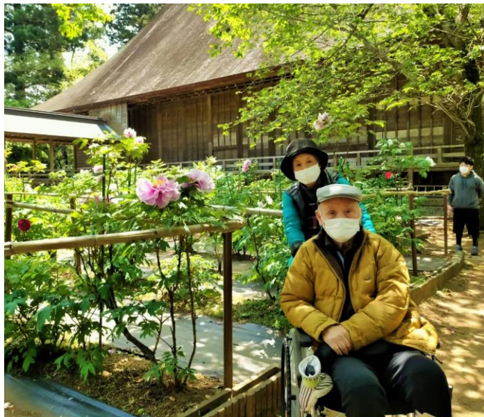
何とか咲き残っていた牡丹