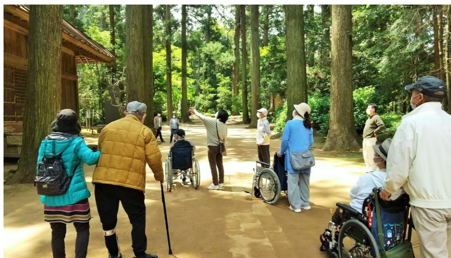
杉並木を散策しながら歴史的建造物を見学

運動しながら自然と歴史を堪能した後は、最後に講堂裏の牡丹園を見学！見学を通じて心の洗濯をしたような、とてもすがすがしい気分になりました。参加者もとても良いリフレッシュになった様子で、特に牡丹の花より美しい付き添いの奥様方の笑顔が印象的でした。車いすの参加者は段差などで見学できない場所があったものの、そのメンバー内で話が盛り上がり、それはそれでとても楽しそうでした(笑)。