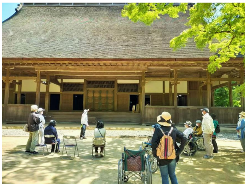
メインの「講堂」の前で平成の大改修の説明を受ける