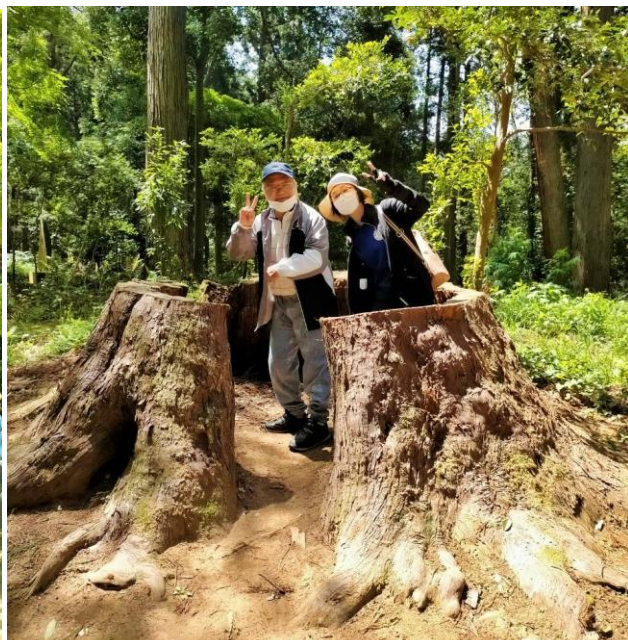
巨木の根は SNS 映えスポット！