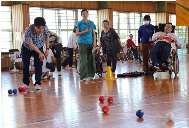
ボッチャに集中してプレー