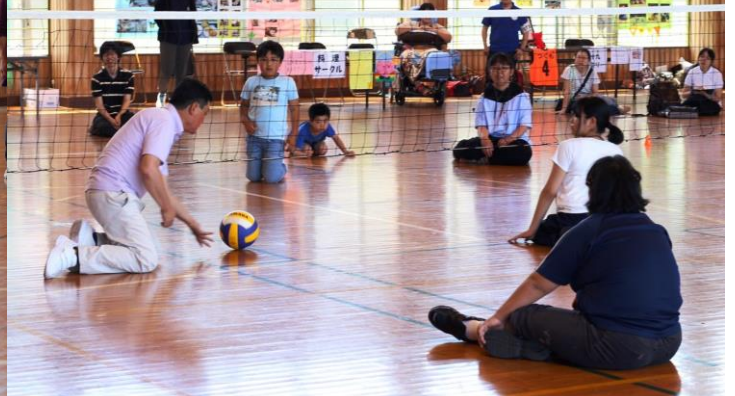
子供も多く参加したローリングバレー