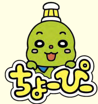
銚子市PRキャラクター「ちょーぴー」

銚子は、坂道や狭い道も多いですが、比較的コンパクトに観光名所を周ることができます。