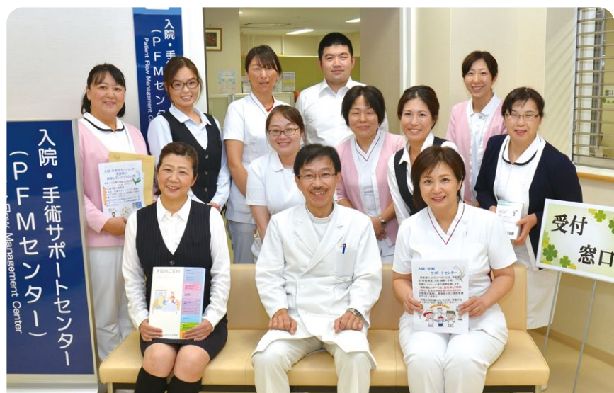
入院・手術サポートセンタースタッフ